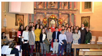
Confirmaciones (Pág. 2)

D urante los últimos días se nos ha bombardeado con el “black Friday”, el “cyber Monday”, los descuentos y oportunidades; llega ahora la Navidad y con ella los regalos; y luego, vendrán las rebajas de enero... Todo orientado al consumo, disfrazándolo de necesidad, de cariño y afecto compartido, de capricho merecido, o felicidad ocasional. Al mismo tiempo, se nos recuerdan los problemas generados por el cambio climático, la contaminación, la escasez de los recursos... Esto es de locos. El consumo requiere de abundantes materias primas, costosos procesos de transformación, elevado gasto de energía. Y seguramente, en nuestro “primer mundo” seremos muy sensibles con el cuidado del planeta, pero se está resintiendo el “tercer mundo” sometido a continua explotación. Para lograr el desarrollo sostenible es necesaria una conversión ecológica en nuestros hábitos diarios. El Papa Francisco recientemente ha calificado al consumismo como “una gran enfermedad” que daña la generosidad. Pongámonos una vacuna de austeridad. No consumamos tanto, por favor.