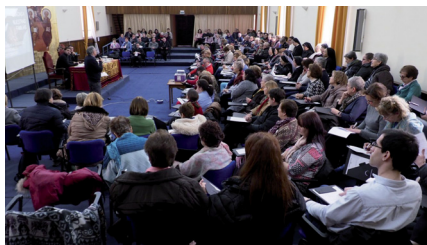
Escuela de Catequistas (Pág. 5)