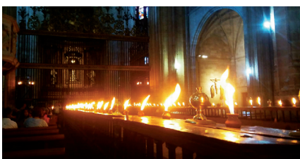
Consagración de la Catedral (Pág. 5)