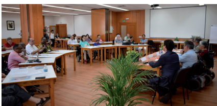
FRATER (Pág. 2)

Pero la educación no se reduce a las aulas, la educación se cimienta en la familia. La educación integral de los hijos es «obligación gravísima», a la vez que «derecho primario» de los padres, también la educación religiosa. El hogar debe seguir siendo el lugar donde se enseñe a percibir las razones y la hermosura de la fe, a rezar y a servir al prójimo. La Iglesia, esto es, la diócesis, las parroquias y las comunidades cristianas, están llamadas a colaborar, con una acción pastoral adecuada, para que los propios padres puedan cumplir con su misión educativa. Por este motivo, uno de los objetivos de la programación diocesana es revitalizar el carácter de Iglesia doméstica de la familia.