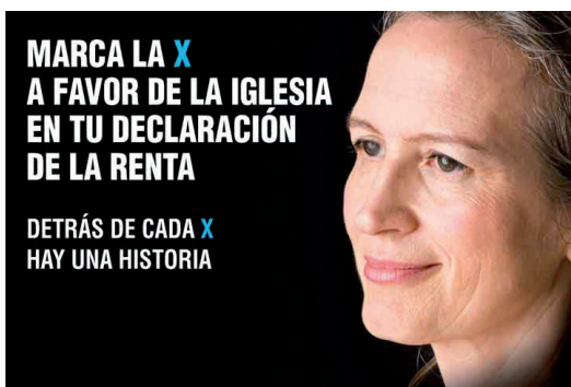
X Tantos. (Pág. 7)