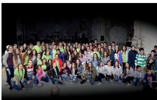
Pastoral Juvenil. (Pág. 5)