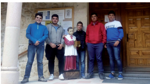
Seminario. (Pág. 2)

En todos los ámbitos de la vida se programa. Empresas, centros educativos, ámbitos políticos... también la Diócesis durante este mes de junio llevará a cabo la programación para el próximo trienio 2018-2021. La misión es la misma: ir y anunciar la Buena Noticia de Jesucristo muerto y resucitado para nuestra salvación, contribuyendo así a la transmisión de la fe cristiana; sin embargo, la llamada a la misión y a la evangelización tienen, hoy, un carácter nuevo. Como dice el Papa Francisco debemos abandonar el cómodo criterio pastoral del «siempre se ha hecho así», lo que implica una mutación de estructuras, costumbres e inercias. Pero al mismo tiempo, se nos pide a todos los miembros de la Iglesia local disponibilidad, generosidad, valentía y apertura a la acción del Espíritu. Sólo si el ilumina nuestra reflexión, inspira nuestra oración y alienta nuestra creatividad podremos ser Iglesia en salida.