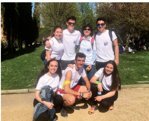
Alumnos de religión. (Pág. 5)