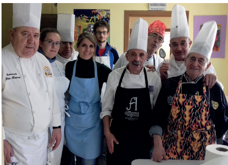
Cocido Solidario (Pág. 4)

Manos Unidas alza su voz y trabaja para lograr, con su esfuerzo diario, la igualdad y dignidad de las personas, cualquiera que sea su raza, cultura y credo religioso. Este año pone su acento en la mujer del siglo XXI, de la que afirma no ser independiente, ni segura ni con voz. «Una de cada tres mujeres de hoy no es como te la imaginas», dice la campaña. Para superar estas injusticias es preciso luchar contra el pecado y las estructuras injustas que los poderes de este mundo establecen como reglas de juego.