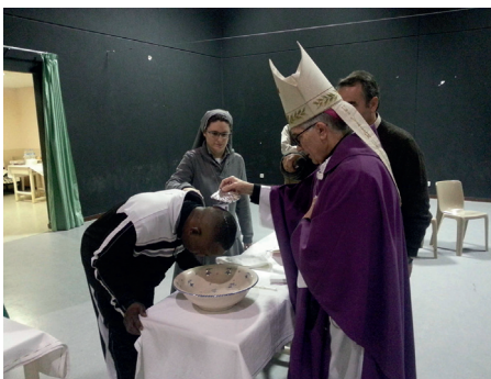
Alegría en la cárcel (Pág. 5)