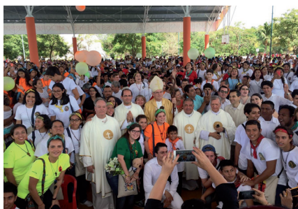
Ecos de la Misión (Pág. 4)