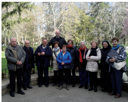
Encuentro de catequistas (Pág. 2)

Con sano realismo y sencillez el Papa Francisco nos recuerda que lo de ser santos no es algo reservado a unos pocos sino que es meta de todo cristiano. Es vocación bautismal. Es deseo del mismo Jesús que nos quiere santos y no espera que nos conformemos con una existencia mediocre, aguada, licuada. Pero ¿cómo ser santos? Primero, de la mano de otros, acompañados y guiados; segundo, descubriendo aquello personal que Dios ha puesto en ti y que debes dar a los demás, sin imitar a nadie, siendo tú mismo; tercero, dejando que la gracia de Dios te modele a imagen de Cristo; cuarto, en la tarea cotidiana, en los actos sencillos; quinto, viviendo a contracorriente y reflejándote en las bienaventuranzas; sexto, con humor y amor; séptimo, en presencia de Dios. Son solo pistas e indicaciones que el Papa propone en su exhortación "Alegraos y regocijaos" para alcanzar el don de la santidad.